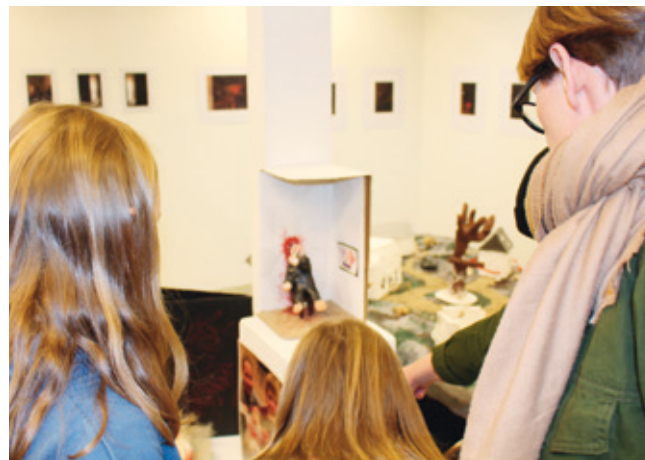
En elevgruppes meget dystre skulptur satte gang i etiske overvejelser hos en lærer. Skulpturen slap dog gennem censuren og kunne således opleves på udstillingen. Her ses et par elever fra en anden skole, der taler med deres lærer om skulpturen.