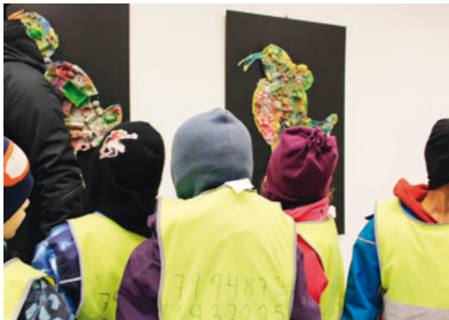
Udstillingsgruppen bag Børnenes Udstilling tæller oftest børn og unge i alle aldre lige fra dagpleje til efterskole.

Dette er historien om et tværprofessionelt og idealistisk børnekulturprojekt med mange ambitioner. Ambitioner om at udfordre samfundets fordomme om, forventninger til samt prioritering af at beskæftige sig med kunst, der er lavet af børn. Men først og fremmest koncentrerer Børnenes Udstilling sig om ... ja, børn! Nærværende artikel vil forsøge at give læseren et lille indblik i dels nogle af de overvejelser, der fra facilitatorernes side ligger bag projektet, dels i hvordan deltagende børn, unge og voksne har